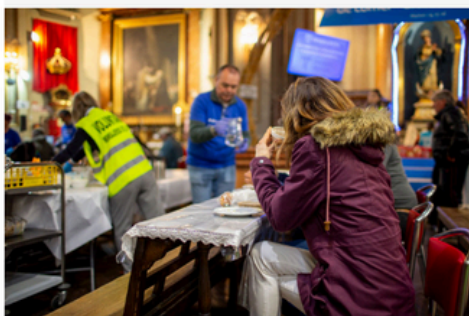
IGLESIA DE SAN ANTÓN