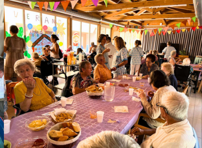
Residencia Don Bosco