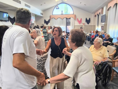
Residencia Montserrat Caballé

Fiesta con los familiares, palabras de cariño y aperitivo con música y baile.